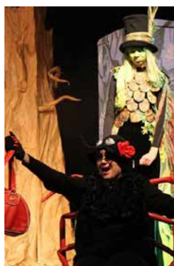
Fot. Katarzyna Mandyk