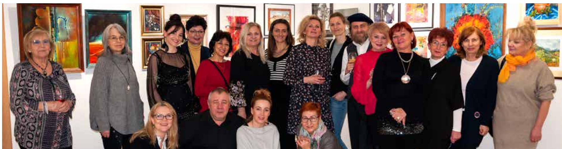
Fot. Zbigniew Gałucki